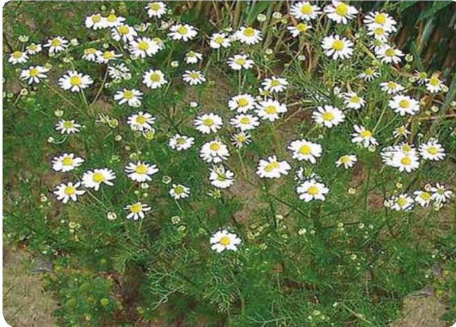
Figura 23. Flor de la manzanilla