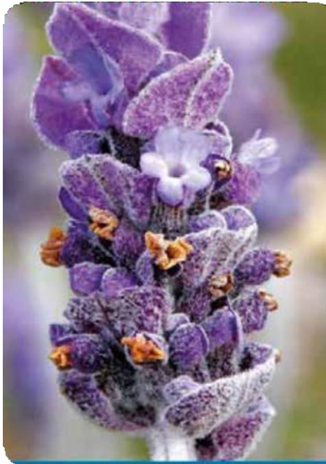
Figura 62. Flor color lila de la lavanda