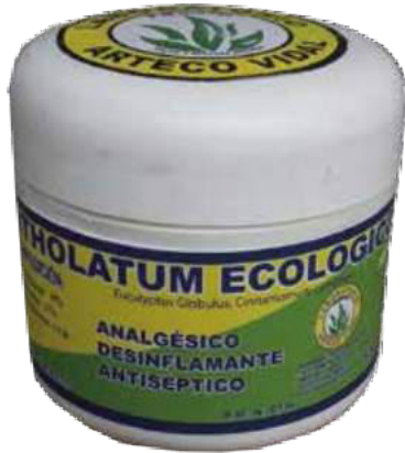
Figura 45. Pomada Mentholatum Ecológico