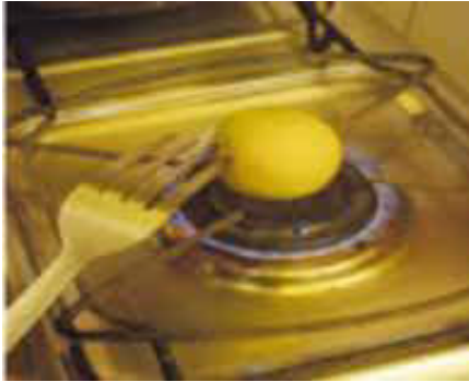
Figura 5. Limón al fuego