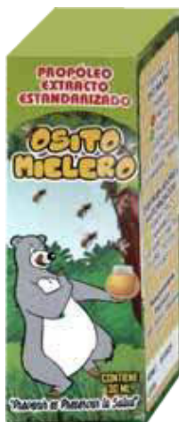
Figura 53. Gotas Osito Mielero Propóleo Extracto