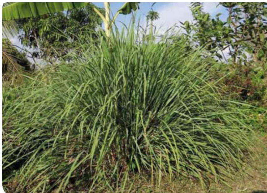
Figura 32. Hojas largas y finas de la paja cedrón