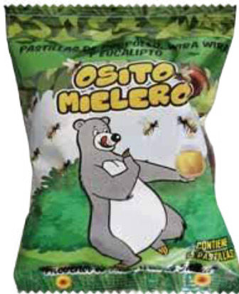
Figura 51. Pastillas Osito Mielero