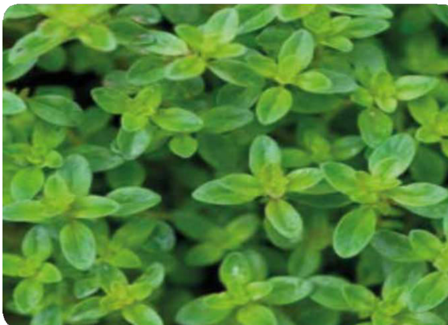
Figura 18. Hojas aromáticas de tomillo