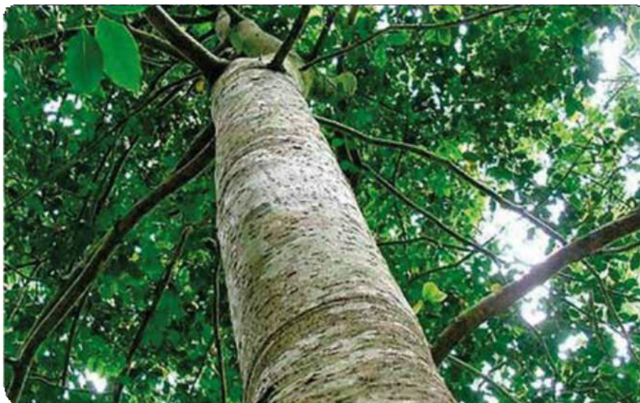
Figura 40. Tronco grueso y alto del copaibo