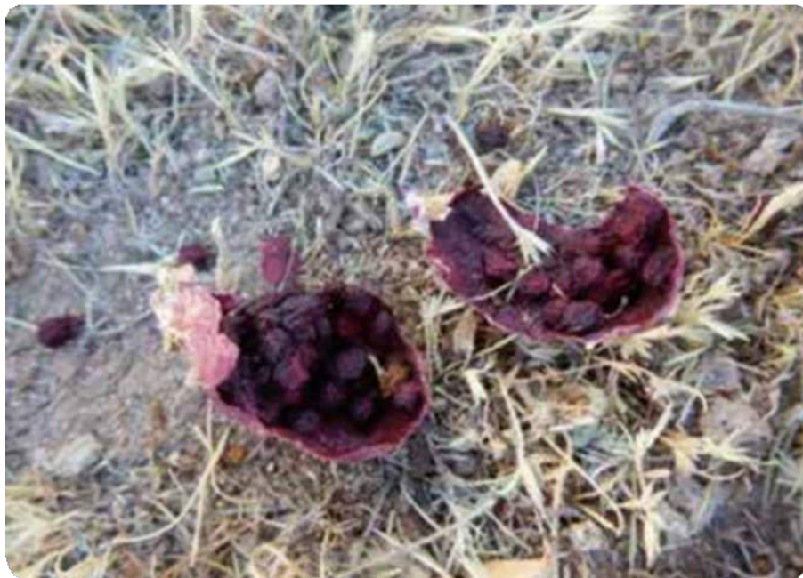
Figura 11. Semillas de Ayrampo