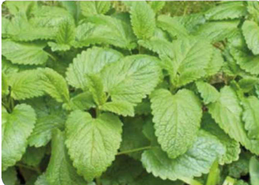
Figura 24. Hojas de la planta del toronjil