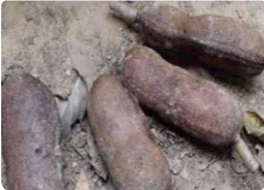
Figura 19. Fruto del paquio