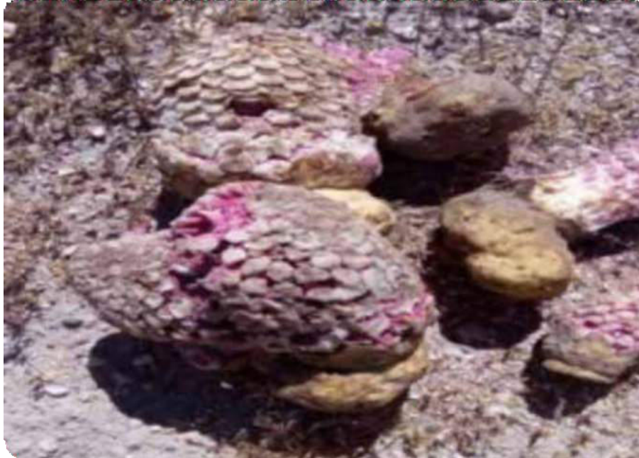
Figura 12. Fruto de la thola o durazno del altiplano