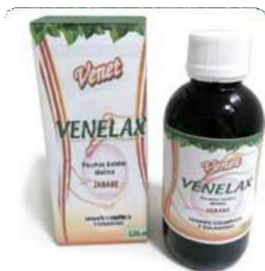
Figura 49. Jarabe Venelax