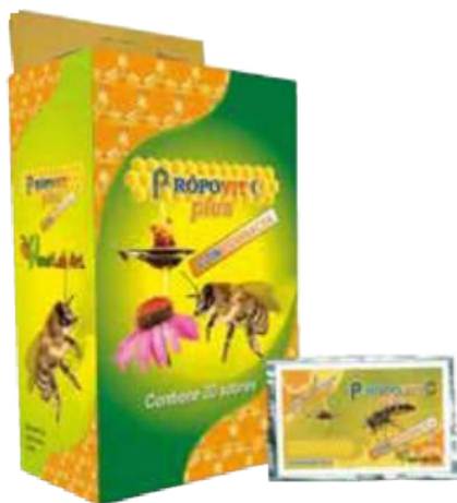
Figura 55. Granulado Propovit C Plus