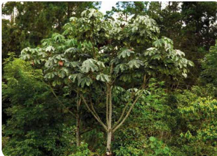
Figura 35. Arbusto del ambaibo