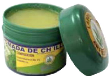
Figura 50. Pomada de Ch'illka