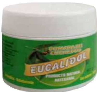
Figura 47. Pomada Eucalidol