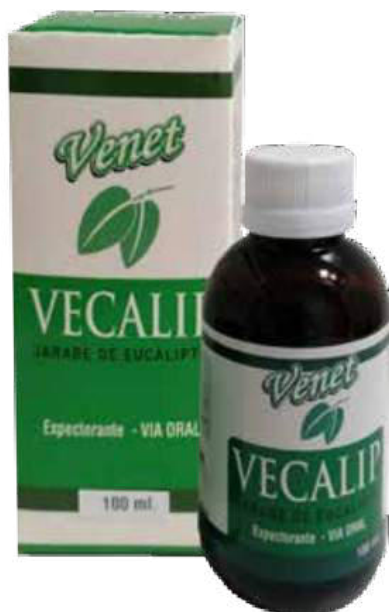
Figura 61. Jarabe Vecalip