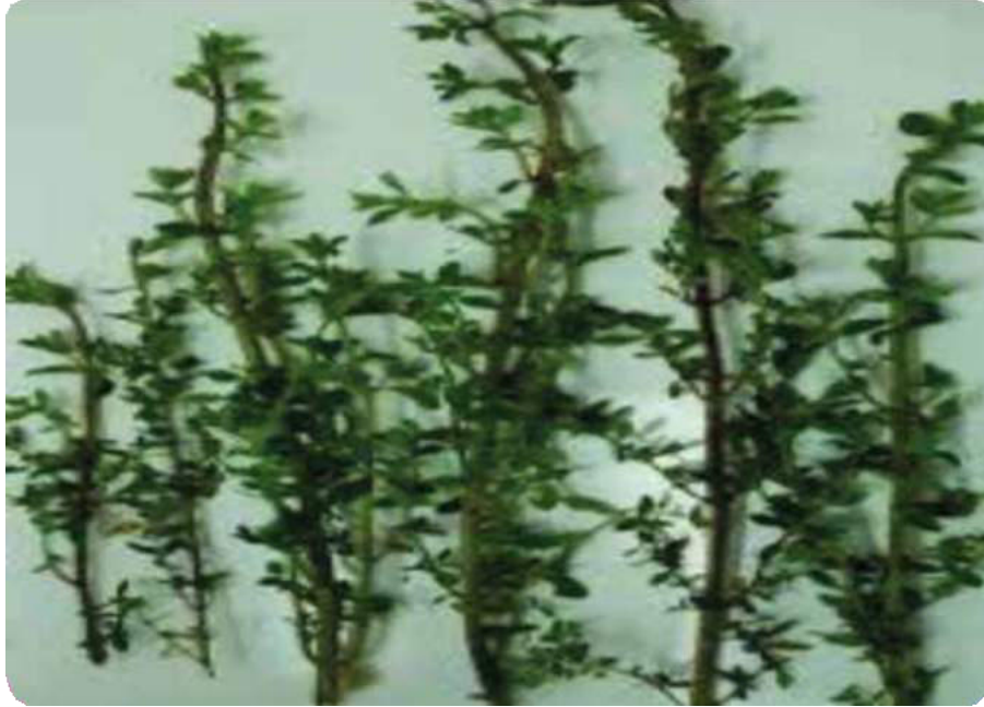
Figura 17. Hojas y tallo de la muña