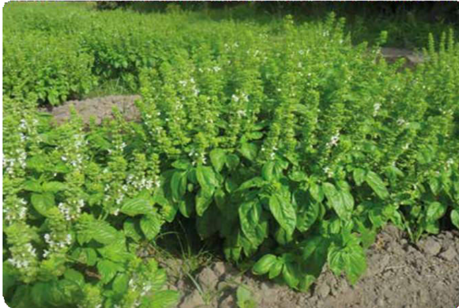
Figura 34. Hojas muy pequeñas de la albahaca