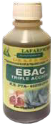
Figura 46. Gotas Ebac Triple