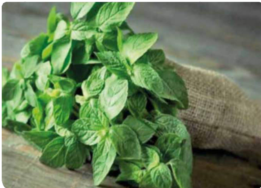
Figura 16. Hojas de la planta de menta