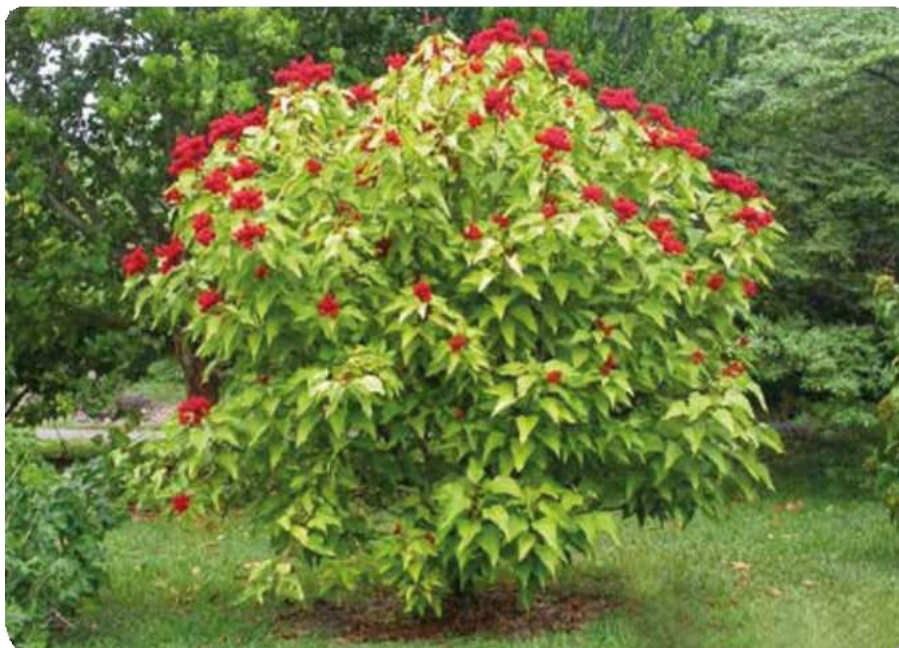
Figura 39. Árbol del urucú con flores rojizas