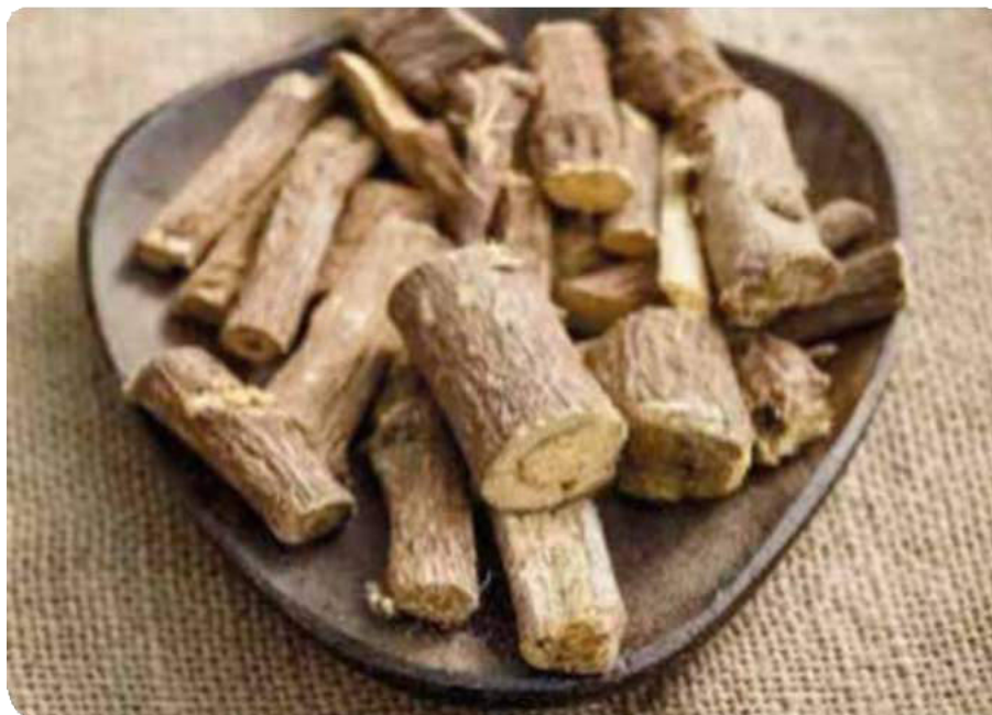
Figura 29. La raíz del regaliz

( Glycyrrhiza glabra , Glycyrrhiza uralensis )