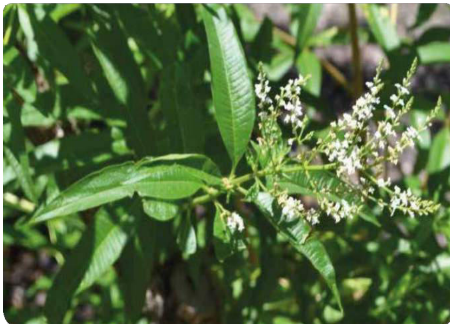
Figura 64. Forma estrellada