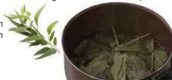
Figura 1. Hervir el eucalipto