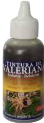
Figura 58. Gotas Tintura de Valeriana