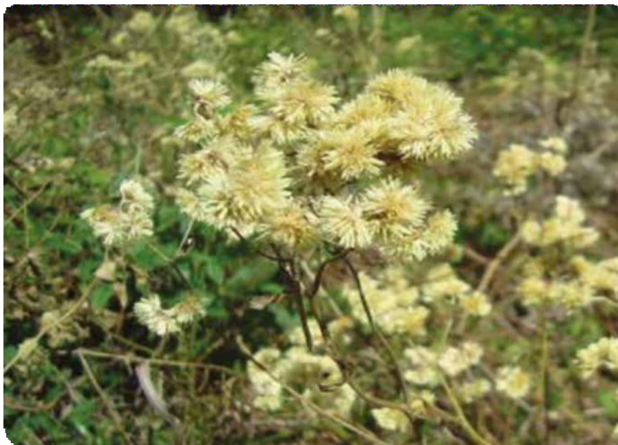
Figura 15. Wira Wira en estado natural