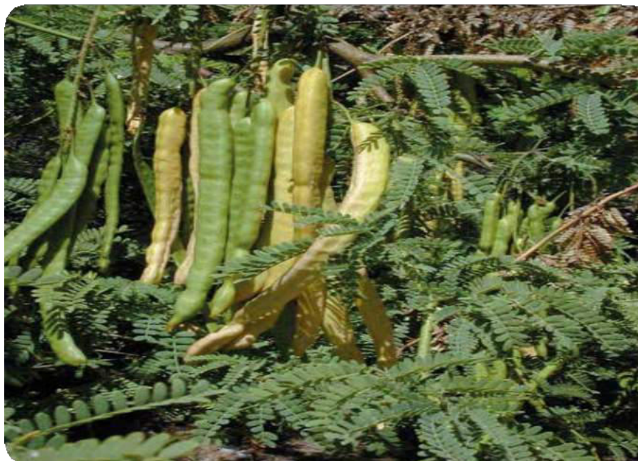
Figura 9. Árbol del cupesi espinoso