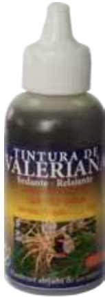
Figura 65. Gotas Tintura de valeriana