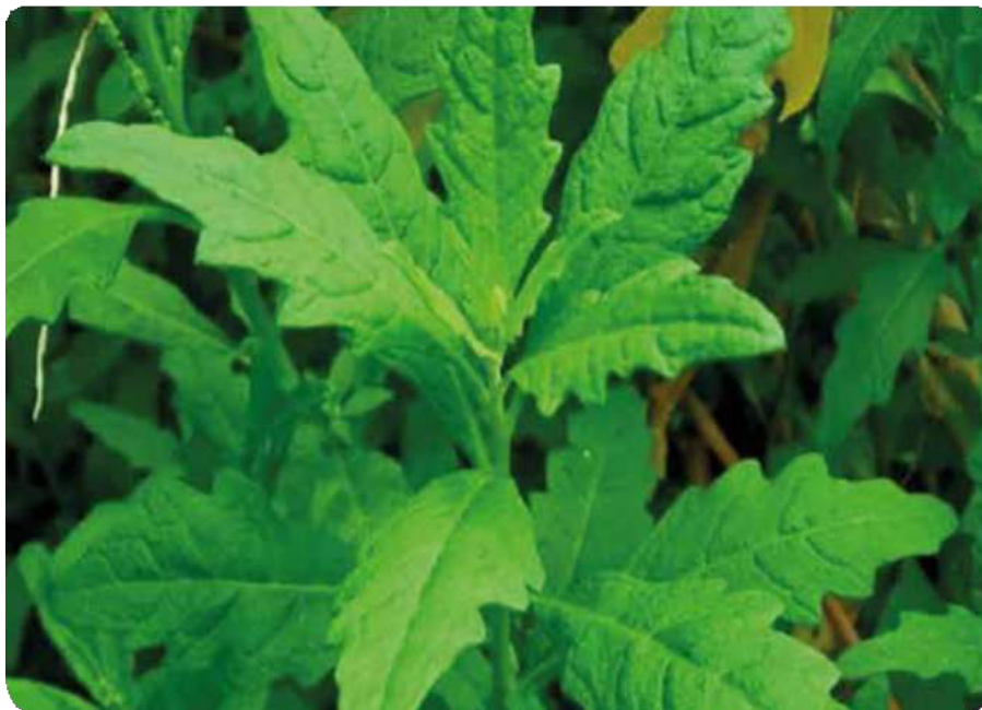
Figura 33. Hojas escalonadas del care o paico