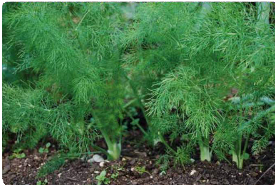
Figura 14. Tallo y hojas del hinojo