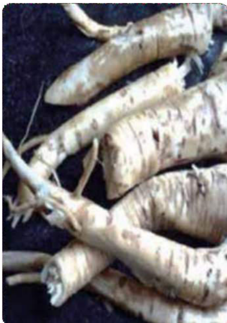
Figura 21. Raíz de la Valeriana