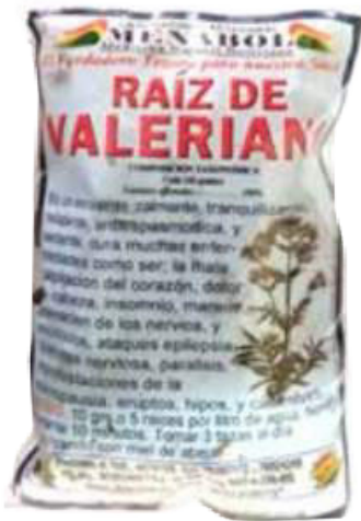
Figura 66. Raíz de valeriana