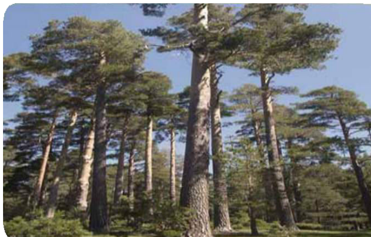
Figura 31. Pino, árbol de tronco fuerte