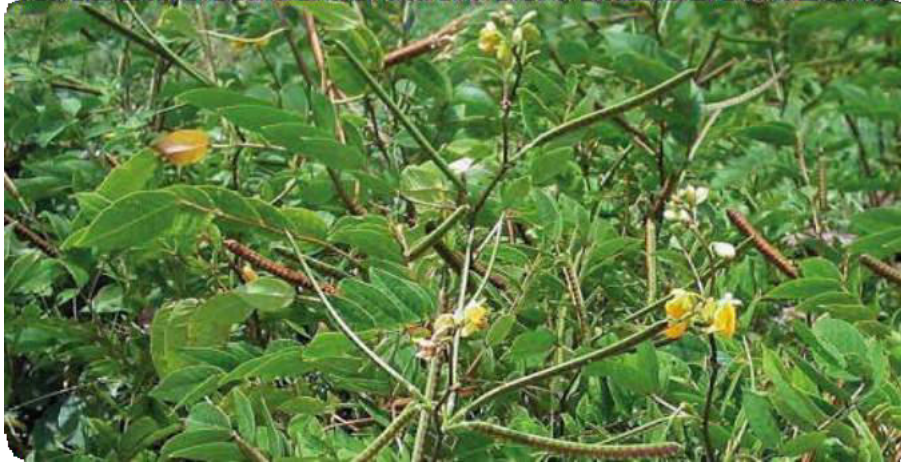
Figura 10. Hojas ovaladas del mamuri