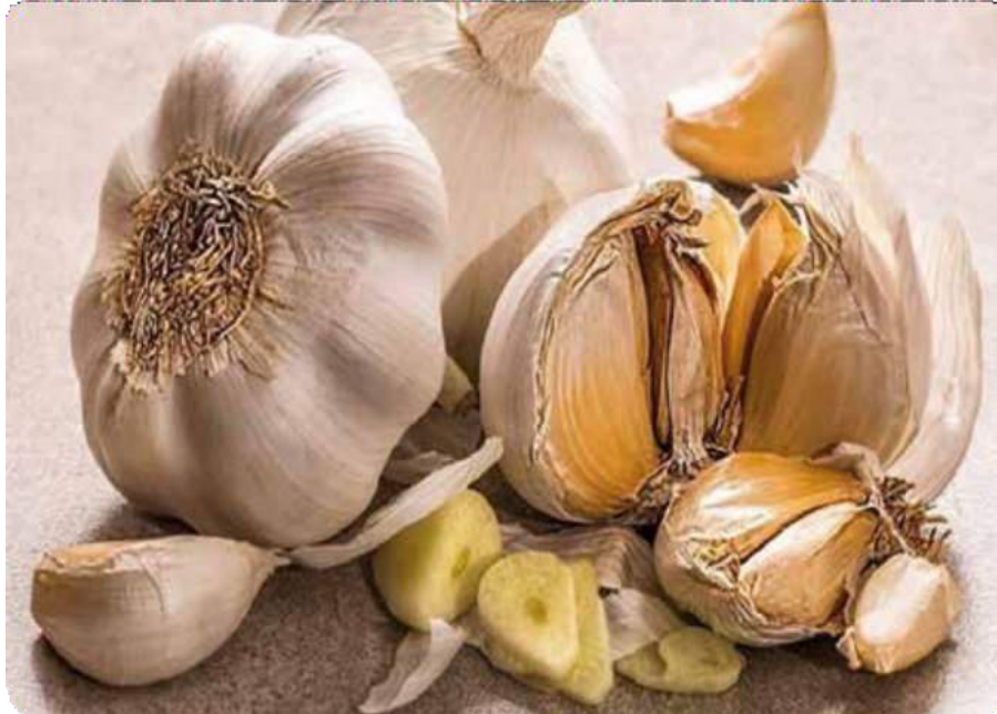
Figura 8. Dientes de ajo