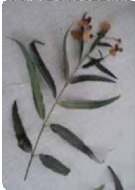
Figura 25. Hojas alargadas del tilo