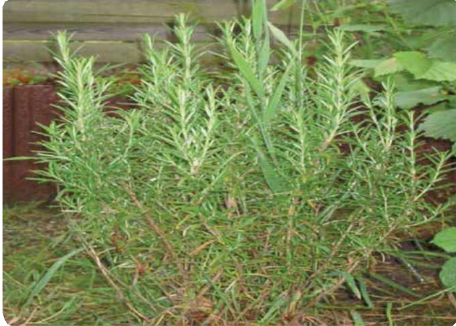
Figura 20. Tallos y hojas del romero