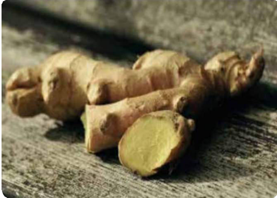
Figura 13. Jengibre, tallo subterráneo