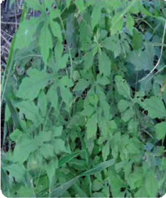
Figura 36. Hojas de la balsamina