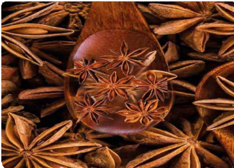
Figura 42. Forma estrellada de este tipo de anís