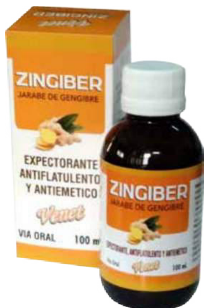
Figura 60. Jarabe Zingiber