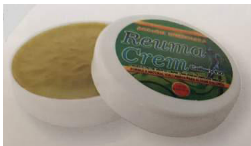
Figura 59. Pomada Reuma Crem