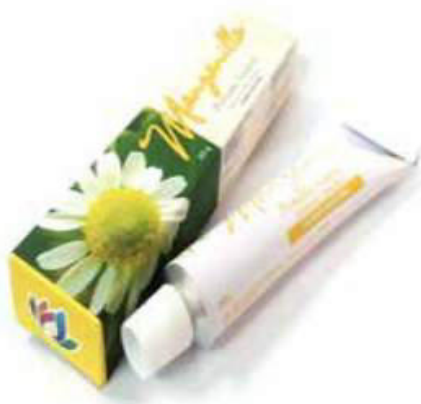
Figura 54. Pomada Manzanilla Natural