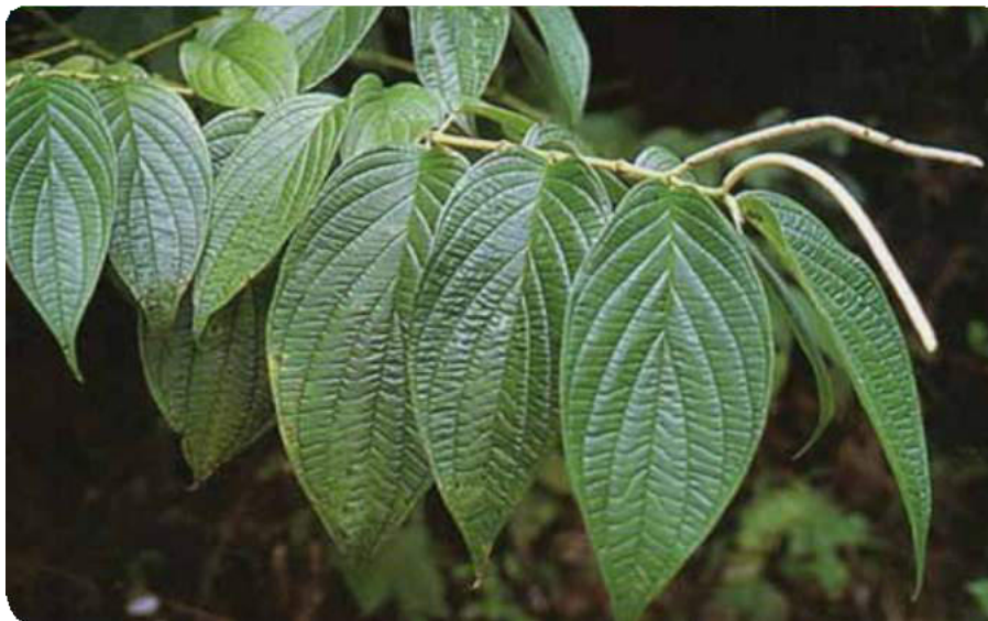
Figura 41. Hojas ásperas del matico