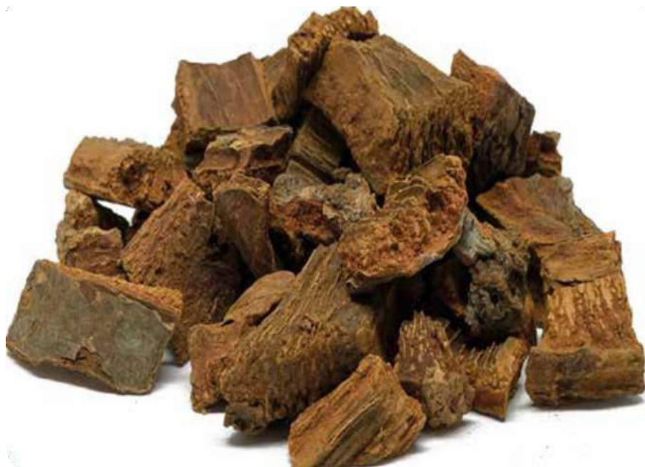
Figura 43. Corteza de la quina