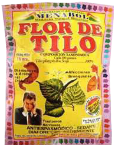
Figura 48. Mate Flor de Tilo