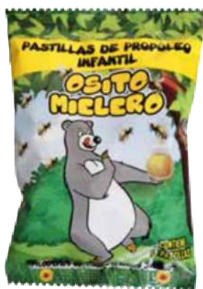
Figura 56. Pastillas Osito Mielero Infantil