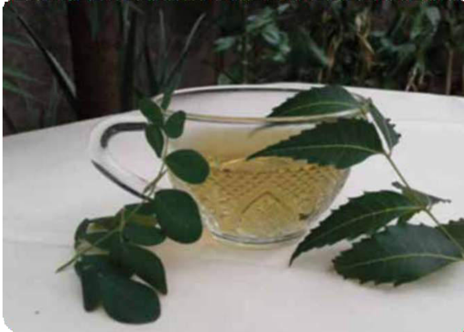
Figura 44. Hojas redondas y largas del neem