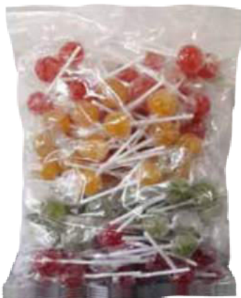
Figura 52. Chupetes Osito Mielero