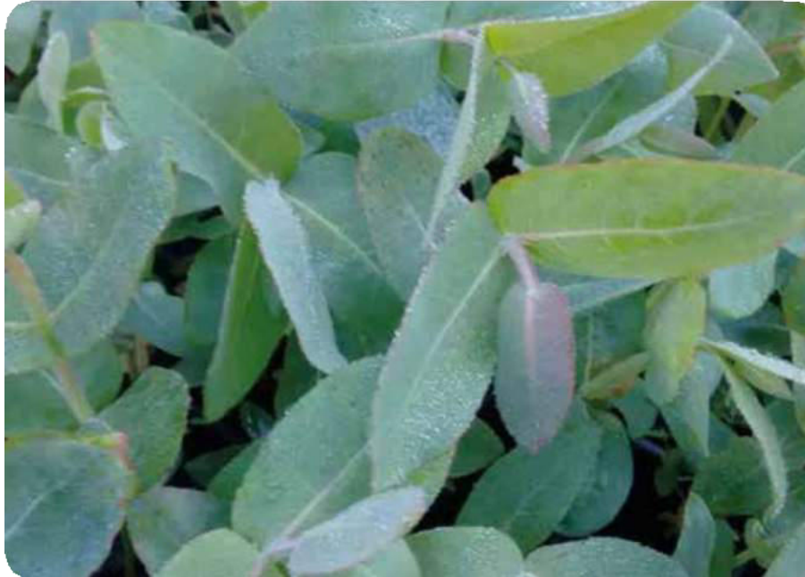
Figura 30. Hojas de eucalipto