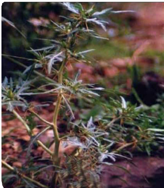
Figura 27. Espinas de amor seco