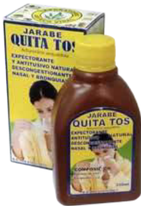
Figura 57. Jarabe Quita Tos