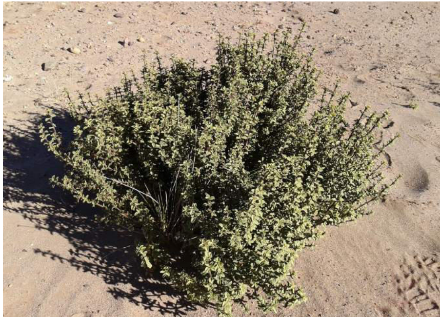
Figura 28. Ramas de la Lampaya