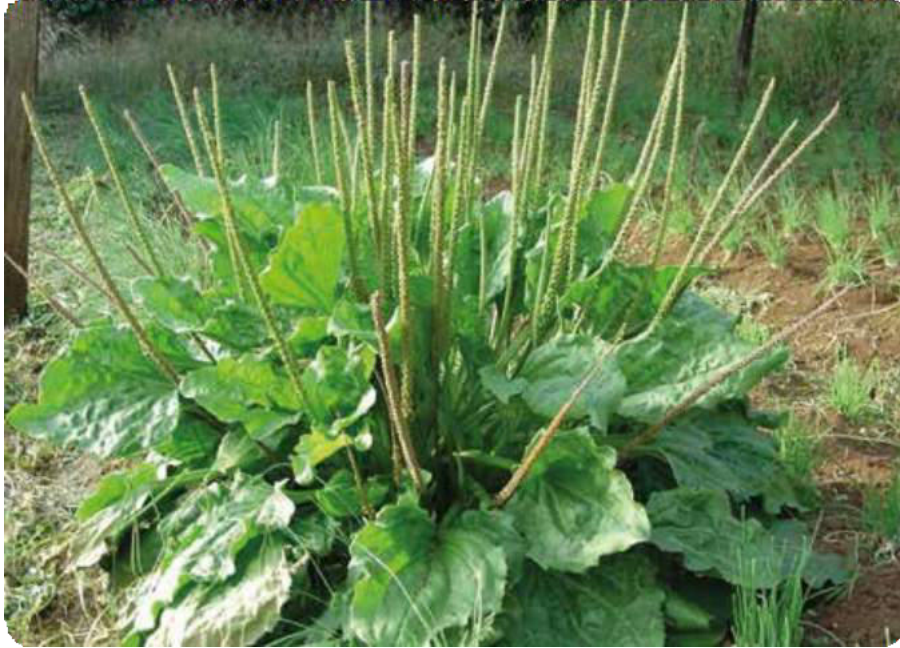
Figura 38. Hojas anchas y espigas el llantén